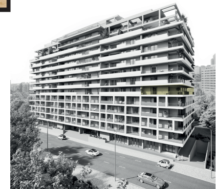
Parque Florestal de Monsanto